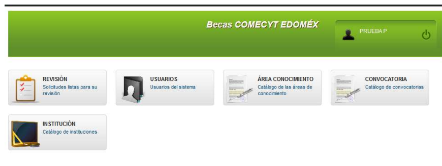
Imagen 16: Pantalla de inicio del usuario revisor.

Al acceder con su usuario y contraseña, el personal revisor puede acceder a las siguientes mostradas en la Imagen 16.