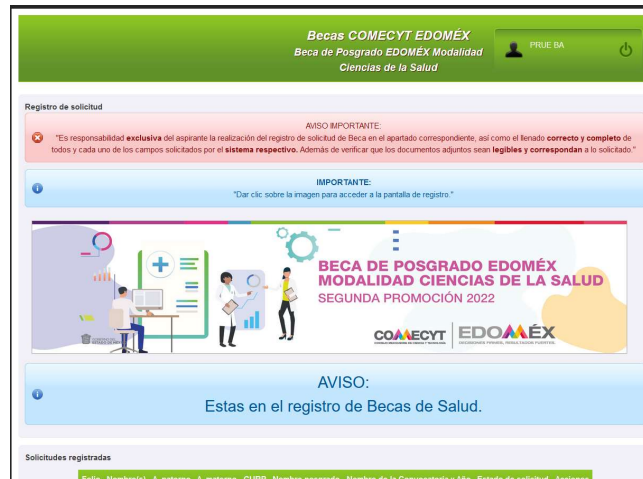
Imagen 6: Pantalla Inicial como usuario solicitante (Modalidad Ciencias de la Salud).