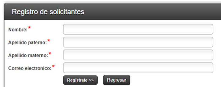
Imagen 3: Campos para la captura de nuevo usuario.

“2022. Año del Quincentenario de la Fundación de Toluca de Lerdo, Capital del Estado de México”.