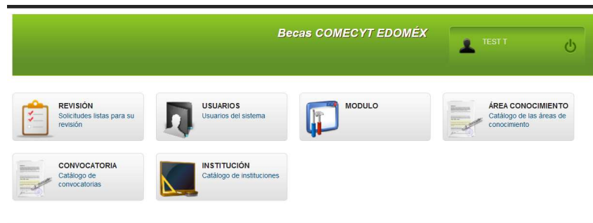
Imagen 22: Pantalla de Inicio del usuario Administrador.

Al acceder con su usuario y contraseña el personal administrador puede acceder a las mismas funciones del sistema que el usuario revisor, además de la opción “Módulo” tal como se muestra en la Imagen 22.