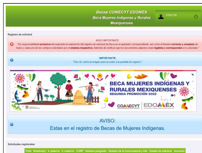
Imagen 7: Pantalla Inicial como usuario solicitante (Modalidad Mujeres Indígenas y Rurales Mexiquenses).