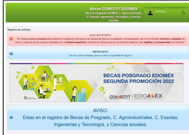
Imagen 5: Pantalla Inicial como usuario solicitante (Modalidad Ciencias Agroindustriales, Ciencias Exactas, Ingenierías y Tecnología y Ciencias Sociales).

“2022. Año del Quincentenario de la Fundación de Toluca de Lerdo, Capital del Estado de México”.