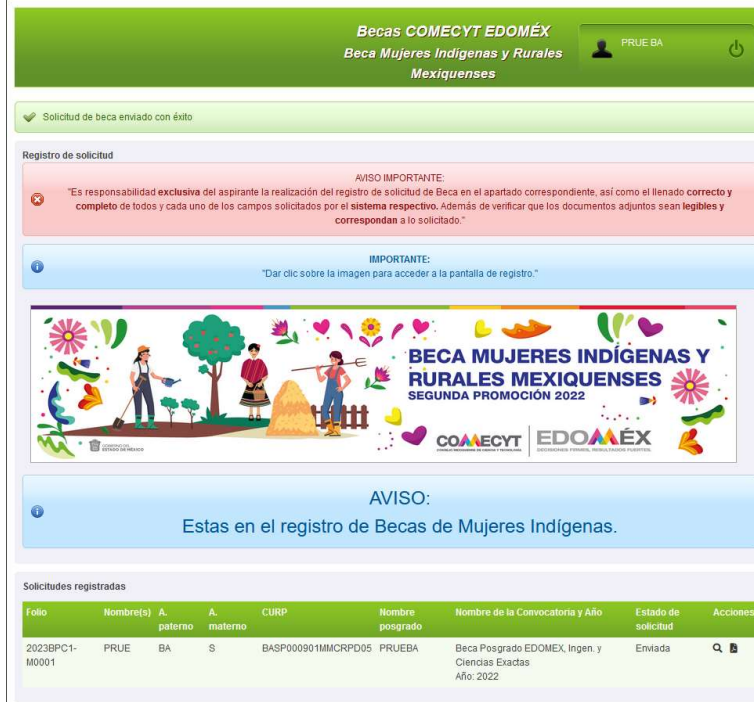
Imagen 15: Pantalla de inicio con la solicitud ya registrada.

“2022. Año del Quincentenario de la Fundación de Toluca de Lerdo, Capital del Estado de México”.